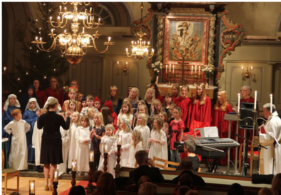
Gudstjänst i Sätila kyrka